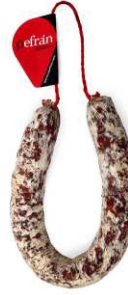
325. CHORIZO IBER. SARTA PICANTE Spicy Iberian High Quality Cured Chorizo Peso unidad(Weight unit): 450g. Unidades/caja(Units/box): 8u. F.Cons.Pref.(Best before): 12m.