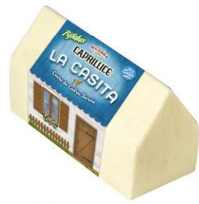
531. QUESO CABRA TIERNO LA CASITA Goat Soft Cheese La Casita Peso unidad(Weight unit): 2.5k. Unidades/caja(Units/box): 2u. F.Cons.Pref.(Best before): 6m.