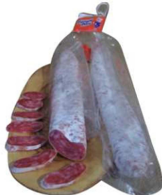
154. ESPETEC EXTRA High Quality Espetec Peso unidad(Weight unit): 180g. Unidades/caja(Units/box): 12u. F.Cons.Pref.(Best before): 6m.