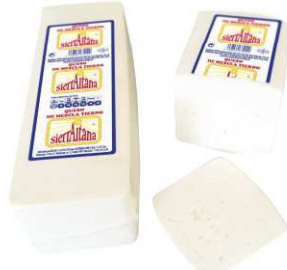
441. QUESO BARRA TIERNO Soft Bar Cheese Peso unidad(Weight unit): 3k. Unidades/caja(Units/box): 2u. F.Cons.Pref.(Best before): 6m.