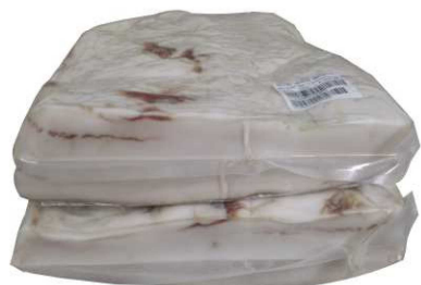
262. TOCINO IBÉRICO CON SECRETO Iberian Pork Back Fat with Secreto Peso unidad(Weight unit): 5k. Unidades/caja(Units/box): 4u. F.Cons.Pref.(Best before): 6m.