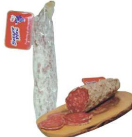
152. LONGANIZA EXTRA PAYES High Quality Longaniza Sausage Peso unidad(Weight unit): 300g. Unidades/caja(Units/box): 12u. F.Cons.Pref.(Best before): 6m.