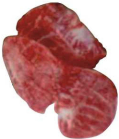
910. CARRILLADA IBÉRICA Iberian Cheek Meat Peso unidad(Weight unit): 1-1.5k. Piezas/bandeja(Pieces/packed): Variable F.Cons.Pref.(Best before): 21d.