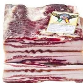
260. PANCETA OREADA C. DUROC Duroc Pork Belly Peso unidad(Weight unit): 4-5k. Unidades/caja(Units/box): 4u. F.Cons.Pref.(Best before): 6m.