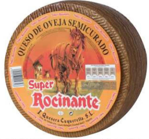
502. QUESO PURO OVEJA SEMI Semicured Pure Sheep's Cheese Peso unidad(Weight unit): 3k. Unidades/caja(Units/box): 2u. F.Cons.Pref.(Best before): 12m.