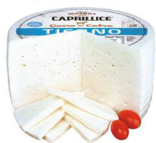
526. QUESO CABRA TIERNO Goat Soft Cheese Peso unidad(Weight unit): 2.5k. Unidades/caja(Units/box): 2u. F.Cons.Pref.(Best before): 6m.