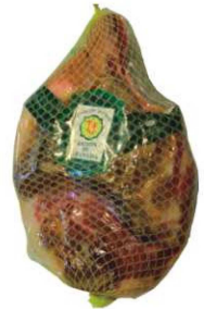
852. JAMÓN GRAN RESERVA DESH. +18M. Boned Serrano Ham. Aging Period of + 18 months Peso unidad(Weight unit): 5-6k. Unidades/caja(Units/box): 2u. F.Cons.Pref.(Best before): 12m.