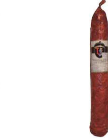
55. CHORIZO ROJO EXTRA CULAR High Quality Cured Chorizo (Red) Peso unidad(Weight unit): 2.4k Unidades/caja(Units/box): 2u. F.Cons.Pref.(Best before): 12m.