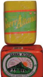
421/422. Q. BARRA ROJA/RÉGIMEN Soft Bar Cheese/Soft Bar Low Fat Cheese Peso unidad(Weight unit): 1.75k. Unidades/caja(Units/box): 6u. F.Cons.Pref.(Best before): 12m.