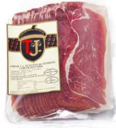
820/821. JAMÓN RESERVA LONCH.+16M Sliced Serrano Ham. A. Period of +16 m. R. to eat. Peso unidad(Weight unit): 500g./200g. Unidades/caja(Units/box): 15u./30u. F.Cons.Pref.(Best before): 5/6m.