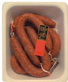
56/584. CHORIZO HER. DULCE/PICANTE Handmade Soft Chorizo / Spicy Chorizo Peso unidad(Weight unit): 2.5k. Unidades/caja(Units/box): 2u. F.Cons.Pref.(Best before): 3m.