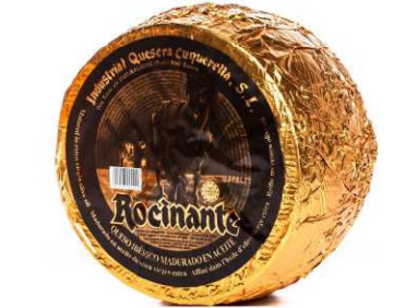
510. Q. CURADO AC. OLIVA V. EXTRA Iberico Cheese · Matured in Extra Virgin Olive Oil Peso unidad(Weight unit): 3k. Unidades/caja(Units/box): 2u. F.Cons.Pref.(Best before): 12m.