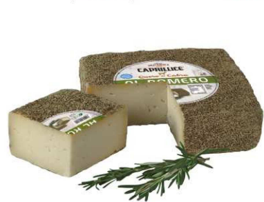
527. QUESO CABRA ROMERO SEMIC. Goat Semi Cured Rosemary Cheese Peso unidad(Weight unit): 2.3k. Unidades/caja(Units/box): 1u. F.Cons.Pref.(Best before): 6m.