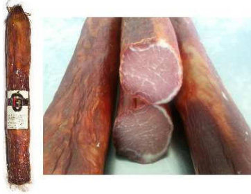
52/53. LOMO EMB. EXTRA D.O. TERUEL Pork Cured Loin Guarantee Origin of Teruel Peso unidad(Weight unit): 2k./1k. Unidades/caja(Units/box): 4u./8u. F.Cons.Pref.(Best before): 6m.