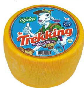
525. Q. CABRA REDUC. SAL BIFIDUS Goat Cheese with Bifidus and Low in Salt Peso unidad(Weight unit): 2.5k Unidades/caja(Units/box): 2u. F.Cons.Pref.(Best before): 6m.