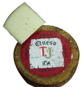
402. QUESO CURADO Cured Cheese Peso unidad(Weight unit): 3k. Unidades/caja(Units/box): 2u. F.Cons.Pref.(Best before): 12m.