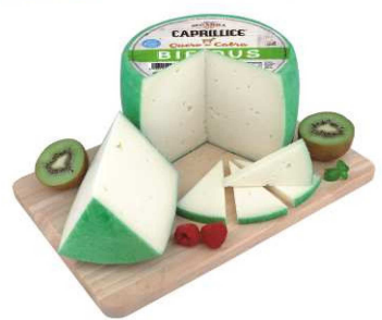
523. QUESO DE CABRA BIFIDUS Air Matured Bifidus Cheese Peso unidad(Weight unit): 2.5k. Unidades/caja(Units/box): 2u. F.Cons.Pref.(Best before): 6m.