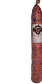
57. CHORIZO BLANCO EXTRA CULAR High Quality Cured Chorizo (White) Peso unidad(Weight unit): 2.4k. Unidades/caja(Units/box): 2u. F.Cons.Pref.(Best before): 12m.