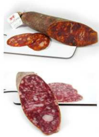
304/305. CHOR. BELL. CULAR/SALCH. Cular Iberian Acorn-Fed Cured Chorizo/Salchichón Peso unidad(Weight unit): 7.2k. Unidades/caja(Units/box): 5u. F.Cons.Pref.(Best before): 24m.