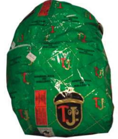
204. SOBRASADA BISBE Bisbe Sobrasada from Majorca Peso unidad(Weight unit): 5-12k. Unidades/caja(Units/box): 1u. F.Cons.Pref.(Best before): 8m.