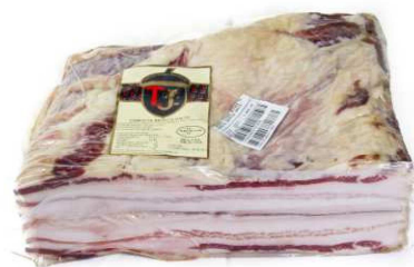
261. PANCETA IBÉRICA Iberian Pork Belly Peso unidad(Weight unit): 4-5k. Unidades/caja(Units/box): 4u. F.Cons.Pref.(Best before): 6m.