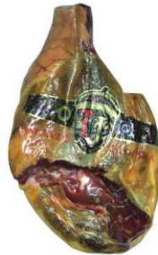
804. JAMÓN RESERVA DESH. +16M Boned Serrano Ham. Aging Period of at Least 16m. Peso unidad(Weight unit): 5-6.5k. Unidades/caja(Units/box): 2u. F.Cons.Pref.(Best before): 12m.