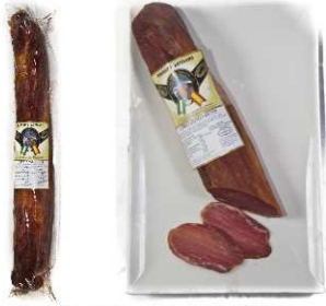
47/48. LOMO EMB. CERDO DUROC B. Quality Duroc Pork Cured Loin Peso unidad(Weight unit): 1.5k./0.75k. Unidades/caja(Units/box): 3u./6u. F.Cons.Pref.(Best before): 6m.