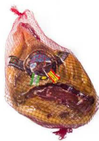
812. JAMÓN G.R. DUROC DESH. +20 Duroc Boned Serrano Ham. Aging Period of + 20m. Peso unidad(Weight unit): 5-6k. Unidades/caja(Units/box): 2u. F.Cons.Pref.(Best before): 12m.