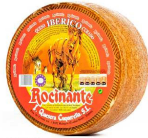
508. QUESO CURADO Cured Iberico Cheese Peso unidad(Weight unit): 3k. Unidades/caja(Units/box): 2u. F.Cons.Pref.(Best before): 12m.