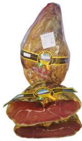
264. JAMÓN S/HUESO +14M. CURAC. Boned Serrano Ham. Aging Period of at Least 14m. Peso unidad(Weight unit): 4.5-6k. Unidades/caja(Units/box): 2u. F.Cons.Pref.(Best before): 12m.