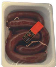
581/585. MORCILLA ART. DULCE/PICANTE Handmade Black Pudding / Spicy Black Pudding Peso unidad(Weight unit): 2.5k. Unidades/caja(Units/box): 2u. F.Cons.Pref.(Best before): 3m.