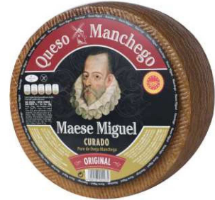
514. MANCHEGO PURO OVEJA D.O.P. Manchego P.D.O. Pure Sheep's Cheese Peso unidad(Weight unit): 3k. Unidades/caja(Units/box): 2u. F.Cons.Pref.(Best before): 12m.