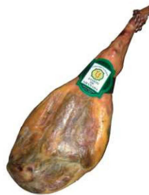
851. JAMÓN G. RESERVA PATA V +18 Serrano Ham. Aging Period of at Least 18 months Peso unidad(Weight unit): 7-10k. Unidades/caja(Units/box): 2u. F.Cons.Pref.(Best before): 12m.