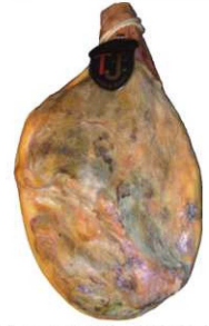
801. JAMÓN RESERVA SIN PATA PIEL+16M Serrano Ham. Aging Period of at Least 16 months Peso unidad(Weight unit): 7-10k. Unidades/caja(Units/box): 2u. F.Cons.Pref.(Best before): 12m.