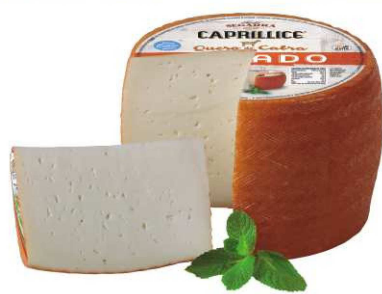
520. QUESO CABRA OREADO RICO Goat Air Matured Cheese Peso unidad(Weight unit): 2.5k. Unidades/caja(Units/box): 2u. F.Cons.Pref.(Best before): 6m.