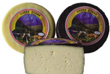
431/432. Q. MANCH. BLANCO/ NEGRO Soft Cheese (White/Black) Peso unidad(Weight unit): 3k. Unidades/caja(Units/box): 2u. F.Cons.Pref.(Best before): 12m.