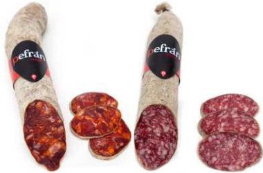
321/322. CHOR. C. EX. IBER. / SALCH. Cular Iberian H. Quality Cured Chorizo / Salchichón Peso unidad(Weight unit): 1.3k Unidades/caja(Units/box): 3u. F.Cons.Pref.(Best before): 12m.