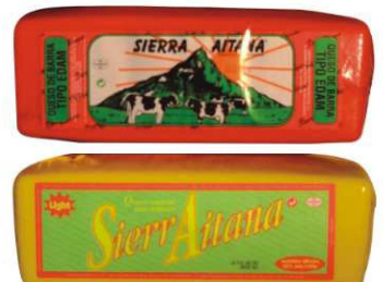
442/443. Q. BARRA ROJA/RÉGIMEN Soft Bar Cheese/Soft Bar Low Fat Cheese Peso unidad(Weight unit): 3.5k. Unidades/caja(Units/box): 3u. F.Cons.Pref.(Best before): 12m.