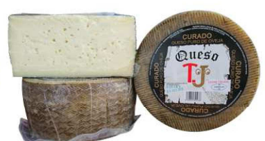
405. Q. CURADO P. OVEJA L. CRUDA Pure sheep's Raw-Milk Hard Cheese Aged 10 m. Peso unidad(Weight unit): 3k. Unidades/caja(Units/box): 2u. F.Cons.Pref.(Best before): 12m.