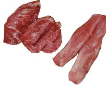
905/906. PRESA IB. / SOLOMILLO IB. Iberian «Presa» / Iberian Tenderloin Peso unidad(Weight unit): 0.8-0.9k./0.9-1k. Piezas/bandeja(Pieces/packed): 2p./3p. F.Cons.Pref.(Best before date): 21d.