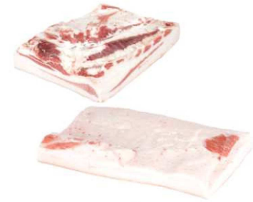
912/913. PANCETA IBÉRICA/ TOCINO Iberian Pork Belly / Iberian Back Fat Rind On Peso unidad(Weight unit): 5-7k/6-7k. Piezas/bolsa(Pieces/bag): 1u. F.Cons.Pref.(Best before): 5d.