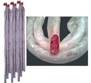
153. ESPETEC EXTRA PAYES METRO High Quality Espetec of a Meter Peso unidad(Weight unit): 750-800g. Unidades/caja(Units/box): 4u. F.Cons.Pref.(Best before): 6m.