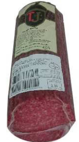
252. SALAMI EXTRA MITADES High Quality Salami. Halves. Peso unidad(Weight unit): 2k. Unidades/caja(Units/box): 2u. F.Cons.Pref.(Best before): 6m.