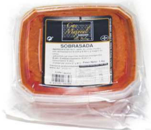
205. SOBRASADA CREMA Cream of Sobrasada from Majorca Peso unidad(Weight unit): 1k. Unidades/caja(Units/box): 2u. F.Cons.Pref.(Best before): 12m.