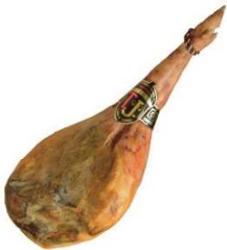
802. JAMÓN RESERVA PATA V +16M. Serrano Ham. Aging Period of at Least 16 months Peso unidad(Weight unit): 6-10k. Unidades/caja(Units/box): 2u. F.Cons.Pref.(Best before): 12m.