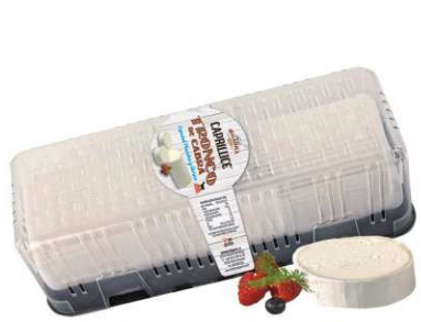
530. TRONCO DE CABRA Roller Goat Cheese Peso unidad(Weight unit): 1k. Unidades/caja(Units/box): 2u. F.Cons.Pref.(Best before): 2m.