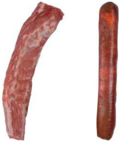
901/902. LOMO IBÉRICO / ADOBADO Iberian Loin / Marinated Iberian Loin Peso unidad(Weight unit): 2-2.5k. Piezas/bolsa(Pieces/bag): 5-6p. F.Cons.Pref.(Best before): 21d/30d.