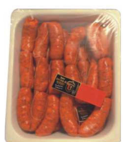
582/586. CHORIZO ART. DULCE/PICANTE Handmade Chorizo / Spicy Chorizo Peso unidad(Weight unit): 2.5k. Unidades/caja(Units/box): 2u. F.Cons.Pref.(Best before): 3m.