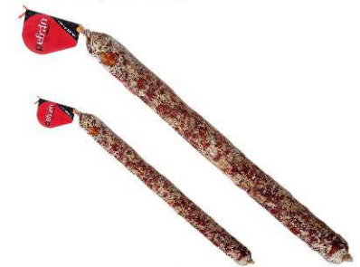
324/327. SALCHICHÓN VELA EX IB / XXL Iberian Cured Salchichón / XXL Peso unidad(Weight unit): 500g./800g. Unidades/caja(Units/box): 8u./4u. F.Cons.Pref.(Best before): 12m.