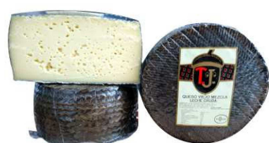
403. QUESO VIEJO LECHE CRUDA Raw-milk Hard Cheese Peso unidad(Weight unit): 3k. Unidades/caja(Units/box): 2u. F.Cons.Pref.(Best before): 12m.