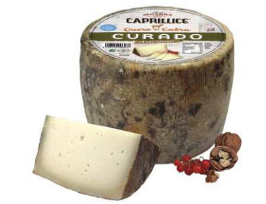
528. Q. CABRA CURADO ARTESANO Goat Cured Cheese Peso unidad(Weight unit): 2.2k. Unidades/caja(Units/box): 2u. F.Cons.Pref.(Best before): 6m.