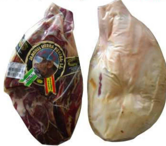
813. J. G. RES. DESH. PULIDO +20 M Duroc Boned Serrano Ham - Ready to cut. +20m. Peso unidad(Weight unit): 5-6k. Unidades/caja(Units/box): 2u. F.Cons.Pref.(Best before): 12m.