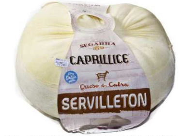
533. QUESO CABRA SERVILLETÓN Goat Soft Cheese Servilletón Peso unidad(Weight unit): 8k. Unidades/caja(Units/box): 1u. F.Cons.Pref.(Best before): 6m.