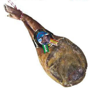
809. PALETA DUROC + 10 MESES Duroc Serrano Ham Shoulder. Aging Period of +10m. Peso unidad(Weight unit): 5k. Unidades/caja(Units/box): 2u. F.Cons.Pref.(Best before): 12m.