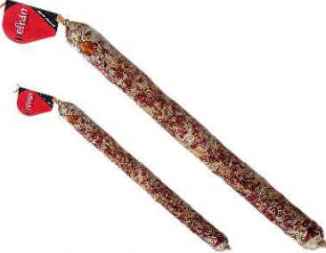
323/326. CHORIZO VELA EX IB / XXL Iberian Cured Chorizo / XXL Peso unidad(Weight unit): 500g./800g. Unidades/caja(Units/box): 8u./4u. F.Cons.Pref.(Best before): 12m.