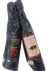
209. S. EX. CERDO NEGRO MALLORQUÍN High Quality Majorcan Black Pig Sobrasada Peso unidad(Weight unit): 0.7-0.8k. Unidades/caja(Units/box): 7u. F.Cons.Pref.(Best before): 8m.