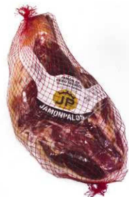
808. JAMÓN 50% IBÉR DESH PULIDO +30 Boned Iberian Ham. Aging Period +30m. R. to Cut Peso unidad(Weight unit): 5-6.5k. Unidades/caja(Units/box): 2u. F.Cons.Pref.(Best before): 12m.