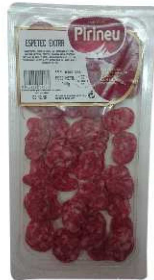
157. ESPETEC EXTRA LONCHEADO High Quality Sliced Espetec Peso unidad(Weight unit): 100g. Unidades/caja(Units/box): 12u. F.Cons.Pref.(Best before): 4m.