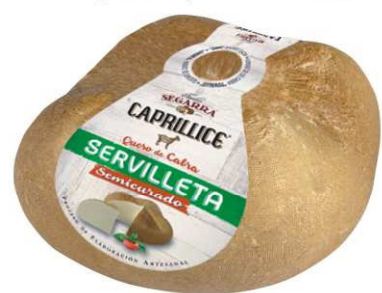
524. Q. CABRA SERVILLETA SEMICUR. Goat Soft Cheese Servilleta Peso unidad(Weight unit): 2k. Unidades/caja(Units/box): 2u. F.Cons.Pref.(Best before): 6m.