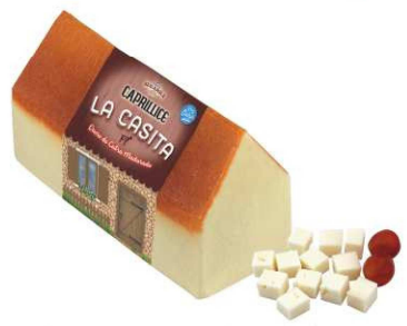
532. CABRA MADURADO LA CASITA Goat Air Matured Cheese La Casita Peso unidad(Weight unit): 2.5k. Unidades/caja(Units/box): 2u. F.Cons.Pref.(Best before): 6m.