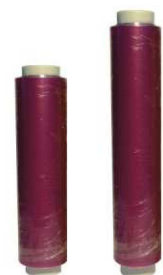
351/353. Film Alimentario Food Contact Film Medidas (Measures): 30cm.x300m./45cm.x300m. Unidades/caja(Units/box): 3u. F.Cons.Pref.(Best before): 12m.