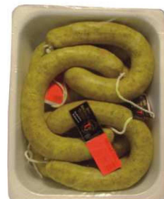
583. RELLENO ARTESANO Handmade Relleno Peso unidad(Weight unit): 2.5k. Unidades/caja(Units/box): 2u. F.Cons.Pref.(Best before): 3m.