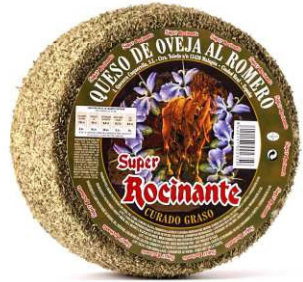
513. QUESO OVEJA AL ROMERO Pure Sheep's Cheese with Natural Rosemary Peso unidad(Weight unit): 3k. Unidades/caja(Units/box): 2u. F.Cons.Pref.(Best before): 12m.