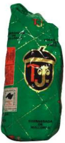
201. SOBRASADA PULTRU Pultru Sobrasada from Majorca Peso unidad(Weight unit): 1.4-2.4k. Unidades/caja(Units/box): 3-4u. F.Cons.Pref.(Best before): 8m.