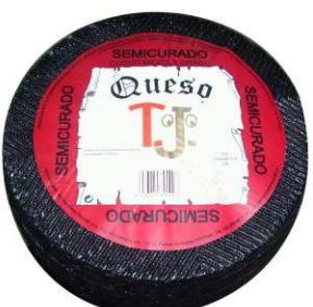
401. QUESO SEMICURADO NEGRO Semi-Cured Cheese Aged 40 days Peso unidad(Weight unit): 3k. Unidades/caja(Units/box): 2u. F.Cons.Pref.(Best before): 12m.