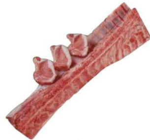
904. CHULETERO IBÉRICO S/AGUJA Iberian Bone-In Loin Peso unidad(Weight unit): 5-5.5k. Piezas/bolsa(Pieces/bag): 1u. F.Cons.Pref.(Best before): 21d.