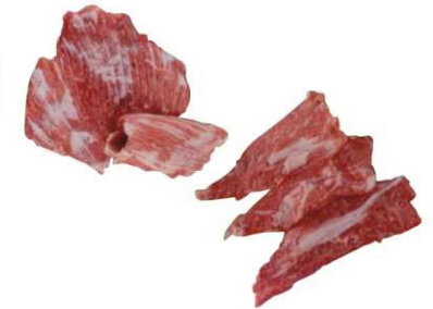
907/908. SECRETO IB. / PLUMA IBER. Iberian «Secreto» / Iberian «Plumas» Peso unidad(Weight unit): 1-1.2k./1-1.5k. Piezas/bandeja(Pieces/packed): 4-6p. F.Cons.Pref.(Best before): 21m.