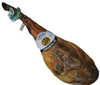
806. JAMÓN CEBO 50% IBÉRICO +30M. Iberian Ham Aging Period of at Least 30 months Peso unidad(Weight unit): 7-10k. Unidades/caja(Units/box): 2u. F.Cons.Pref.(Best before): 12m.