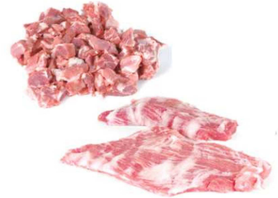
914/916. MAGRO IB./ SECRETO PANC. Iberian Meat / Iberian Pork Belly «Secreto» Peso unidad(Weight unit): 1-1.5k./1-1.5k. Piezas/bandeja(Pieces/packed): -3/4u. F.Cons.Pref.(Best before): 21d.