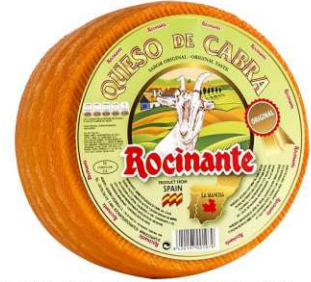
509. QUESO CABRA PIMENTÓN Semicured Pure Goat's Cheese Peso unidad(Weight unit): 3k. Unidades/caja(Units/box): 2u. F.Cons.Pref.(Best before): 12m.