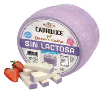
521. QUESO CABRA MADURADO Goat Matured Cheese Peso unidad(Weight unit): 2.5k. Unidades/caja(Units/box): 1u. F.Cons.Pref.(Best before): 6m.