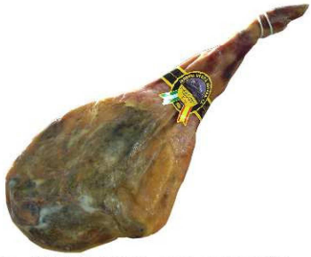
265. JAMÓN PATA V +14M. CURACIÓN Serrano Ham. Aging Period of at Least 14 months Peso unidad(Weight unit): 6-8k. Unidades/caja(Units/box): 2u. F.Cons.Pref.(Best before): 12m.