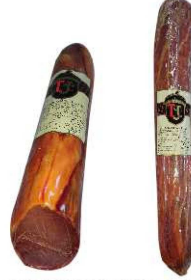
50/54. LOMO EMBUCHADO BODEGA Pork Cured Loin Peso unidad(Weight unit): 1k./2k. Unidades/caja(Units/box): 8u./4u. F.Cons.Pref.(Best before): 6m.