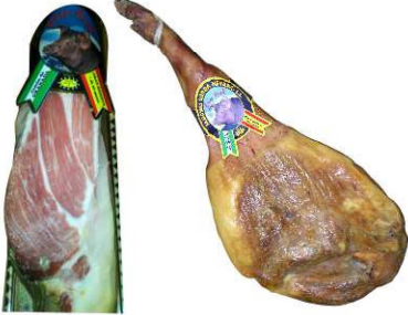
811. JAMÓN G. RESER DUROC +20 M Duroc Serrano Ham. Aging Period of at Least 20m. Peso unidad(Weight unit): 6-10k. Unidades/caja(Units/box): 2u. F.Cons.Pref.(Best before): 12m.