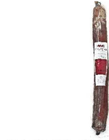
49. LOMO EMB. CERDO DUROC B. Quality Duroc Pork Cured Loin Peso unidad(Weight unit): 1.8k. Unidades/caja(Units/box): 4u. F.Cons.Pref.(Best before): 12m.